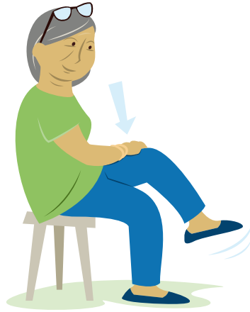
Bild och text till övningarna har inspirerats från broschyren "Styrk kroppen og let hverdagen – det er aldrig for sent!"